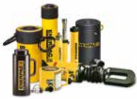
Hydraulikzylinder und Hebegeräte