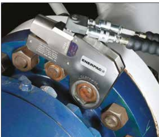
◀ Verschraubungspumpen der ZE4T-Serie sind auf diesen W2000X-Drehmomentschlüssel perfekt abgestimmt.

Z Stabil, zuverlässig und innovativ CLASS